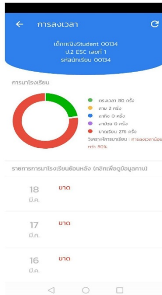
รูปที่ 5 หน้าการแสดงการลงเวลา

ท่านสามารถทำได้โดยการเลือกเมนู (สัญลักษณ์) ชิด3ขีด บริเวณมุมซ้ายบนและเลือกเมนู ข้อมูลนักเรียน หลังจากนั้นระบบจะพาท่านมายังหน้าโปรไฟล์นักเรียนให้ท่านเลือกเมนูการลงเวลา ระบบจะพาท่านมายังหน้ารูปดังกล่าว