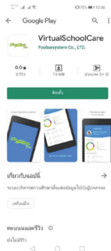
รูปผลการค้นหา แอปฯ Virtual school care ใน Play Store

หลังจากเปิดแอปฯ Play Store และ App Store แล้ว ให้พิมพ์ Virtualschoolcare ในช่องค้นหาที่บริเวณด้านบนของหน้าแอปฯ และกดค้นหาจากนั้นท่านจะได้ผลลัพธ์ดังรูป