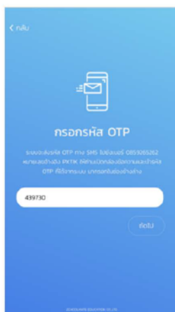
รูปที่ 3 หน้าสำหรับให้ผู้ใช้กรอกรหัส OTP

ขั้นตอนที่ 3 ระบบจะทำการส่งรหัส OTP ไปให้ผู้ใช้ตามหมายเลขที่ผู้ใช้ได้ทำการกรอกให้ผู้ใช้ทำการกรอกรหัส OTP ที่ได้รับจากระบบแล้วกดปุ่ม ถัดไป ดังรูป