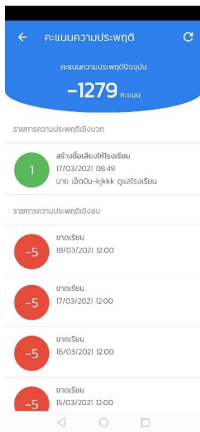
รูปที่ 6 หน้าคะแนนความประพฤติ

ท่านสามารถทำได้โดยการเลือกเมนู (สัญลักษณ์) ชิด3ชิด บริเวณมุมซ้ายบนและเลือกเมนู ข้อมูลนักเรียน หลังจากนั้นระบบจะพาท่านมายังหน้าโปรไฟล์นักเรียนให้ท่านเลือกเมนูคะแนนความประพฤติระบบจะพาท่านมายัง หน้ารูปดังกล่าว