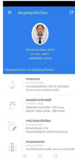
รูปที่ 4 หน้าโปรไฟล์ของนักเรียน

สำหรับหน้าดังกล่าวรอสักครู่ระบบจะนำผู้ใช้เข้าสู่หน้าแรกของแอปฯ หลังจากท่านเข้าสู่ระบบแล้วระบบจะพาท่านมายังหน้าโปรไฟล์นักเรียน จะได้ดังตัวอย่างถัดไป