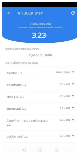
รูปที่ 8 หน้าคะแนนและเกรด

ท่านสามารถทำได้โดยการเลือกเมนู (สัญลักษณ์) ชิด3ขีด บริเวณมุมซ้ายบนและเลือกเมนู ข้อมูลนักเรียน หลังจากนั้นระบบจะพาท่านมายังหน้าโปรไฟล์นักเรียน ให้ท่านเลือกเมนูคะแนนและเกรดระบบจะพาท่านมายังหน้ารูปดังกล่าว