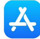
ไอคอน App Store ในระบบปฏิบัติการIOS

***หมายเหตุ*** หากผู้ใช้งานไม่สะดวกในการค้นหาจากแอปพลิเคชัน สามารถสแกนได้จากคิวอาร์โค้ดได้ทั้งระบบปฏิบัติการแอนดรอยด์ และ ระบบปฏิบัติการIOS