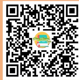
Qr Code โหลด Application Virtual school care