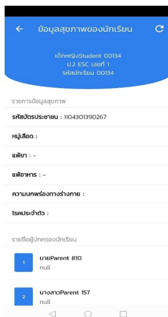
รูปที่ 11 หน้าข้อมูลสุขภาพของนักเรียน

ท่านสามารถทำได้โดยการเลือกเมนู (สัญลักษณ์) ชิด3ขีด บริเวณมุมซ้ายบนและเลือกเมนู ข้อมูลนักเรียน หลังจากนั้นระบบจะพาท่านมายังหน้าโปรไฟล์นักเรียน ให้ท่านเลือกเมนูข้อมูลสุขภาพของนักเรียน ระบบจะพาท่านมายัง หน้ารูปดังกล่าว