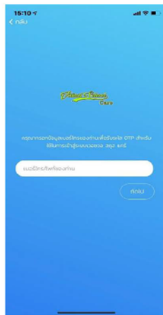
รูปที่ 2 หน้าสำหรับกรอกหมายเลขโทรศัพท์

ขั้นตอนที่ 2 ระบบจะให้ผู้ใช้ทำการกรอกหมายเลขโทรศัพท์ที่ผู้ใช้ได้ทำการแจ้งไว้ให้กับทางโรงเรียน แล้วกดปุ่มถัดไป ดังรูป