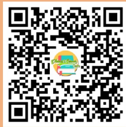
Qr Code โหลด Application Virtual school care

***หมายเหตุ*** หากผู้ใช้งานไม่สะดวกในการค้นหาจากแอปพลิเคชัน สามารถสแกนได้จากคิวอาร์โค้ดได้ทั้งระบบปฏิบัติการแอนดรอยด์ และ ระบบปฏิบัติการIOS